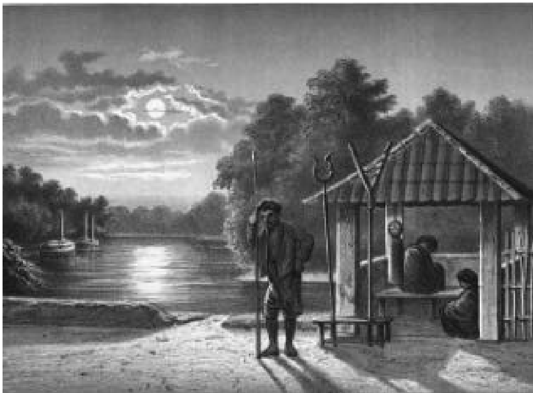
Wachthuisje met nachtwakers. Particuliere collectie