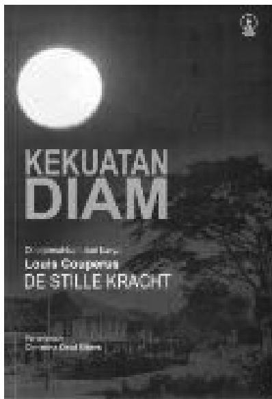
Omslag van de Indonesische vertaling van De stille kracht (2011). Particuliere collectie

In bijna alle Indonesische recensies wordt dit standpunt gedeeld. De critici benadrukken dat De stille kracht het verhaal