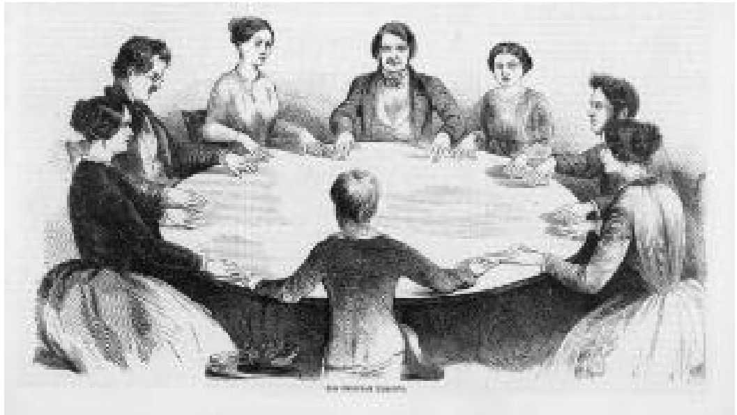
Een tafeldans.

bekende tafeldansscène, wordt van hen gevraagd om een scène te schrijven vanuit het perspectief van een Javaanse bediende die voor Van Oudijck werkt en die in De stille kracht geen stem krijgt, en moeten ze een griezelverhaal schrijven vanuit het perspectief van een soldaat die naar het huis van Van Oudijck wordt gestuurd en getuige is van de bizarre en beangstigende gebeurtenissen 's nachts in de badkamer: 'Gebruik in je verhaal elementen uit De stille kracht (zoals pontianaks , de witte hadji , sirih , vallende stenen, etc.)'.