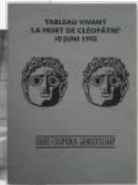
Terugblik op het tableau vivant voor de Leidse Taffeh-tempel, Leidsch Dagblad, 12 juni 1995. Inzet: Voorzijde van het programmaboekje voor de genootschapsbijeenkomst in het Rijksmuseum van Oudheden in Leiden.