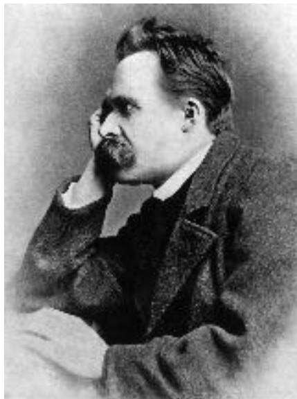
Links: omslag van Couperus. Een leven, 2016. Rechts: Portret van Friedrich Nietzsche, 1882. Foto: Gustav-Adolf Schultze, Naumburg. Wikimedia